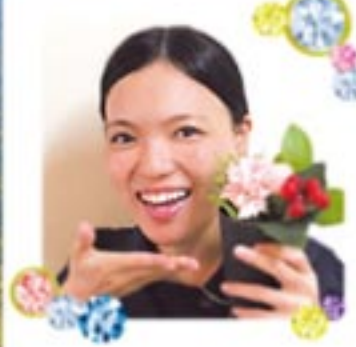
皆さん、こんにちは!